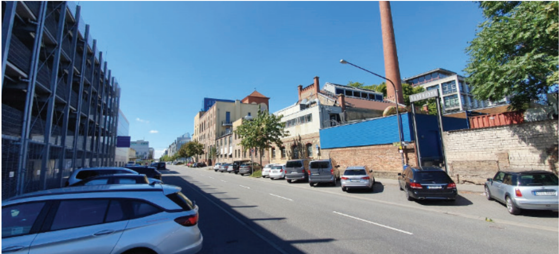
UNION PARKHAUS (LINKS)*